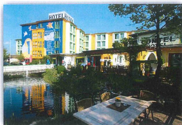
CONTEL Hotel Koblenz